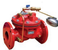
Float Control Valve VLF-F-700