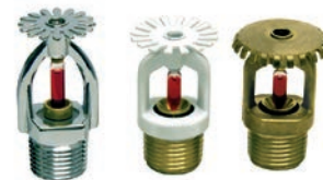
Fire Sprinklers VLF-F-1700