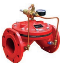
Relief Control Valve VLF-D-QRV

Предохранительный регулирующий клапан VLF-D-QRV