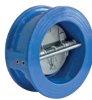
Dual Plate Check Valve VLF-C-800