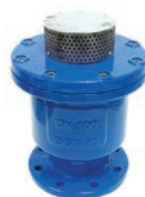
Dynamic Air Valve VLF-AV-200