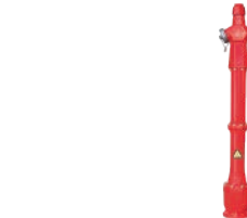
Overground Fire Hydrant VLF-F-1400

Flanged · Фланцевое TS EN 1092/ISO 7005-2