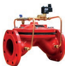
Solenoid Control Valve VLF-D-SCV

Электромагнитный регулирующий клапан VLF-D-SCV