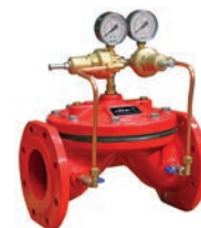
Pressure Reducing & Sustaining Valve VLF-D-PSVR

Клапан снижения и поддержания давления VLF-DPSVR