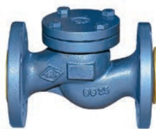
Spring Check Valve VLF-C-400