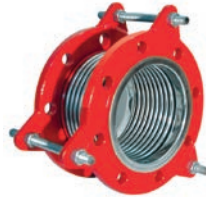
Vibrating Expansion Joint VLF-EJ-500