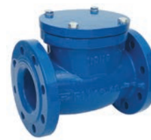
Swing Check Valve VLF-C-300