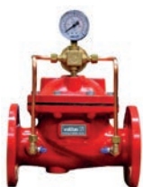
Pressure Reducing Valve VLF-F-500