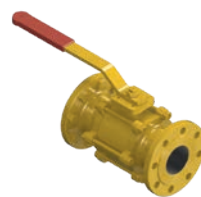
Natural Gas Ball Valve VLF-KV-300