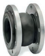
Rubber Expansion Joint VLF-EJ-100