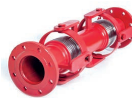
Earthquake Expansion Joint VLF-EJ-300