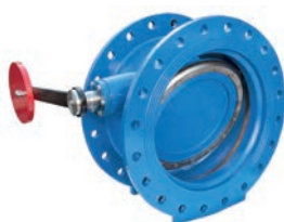
Tilting Check Valve VLF-C-100