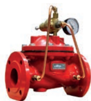
Relief Control Valve VLF-F-600