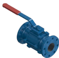
Ball Valve PN 16 VLF-KV-200