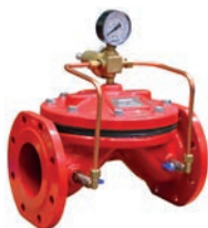
Pressure Reducing Valve VLF-D-PRV