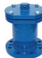
Single Ball Air Valve VLF-AV-300

AISI 304 Stainless Steel · Нержавеющая сталь