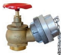
Angle Hose Valve VLF-F-1000