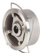
Disc Check Valve VLF-C-700