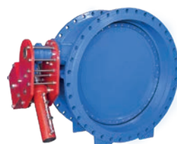
Hydraulic Brake Tilting Check Valve VLF-C-200

Гидравлический обратный клапан с наклонной пластиной