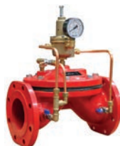
Pressure Sustaining Valve VLF-D-PSV