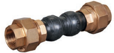
Threaded Rubber Expansion Joint VLF-EJ-600