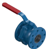
Ball Valve PN 10 VLF-KV-100