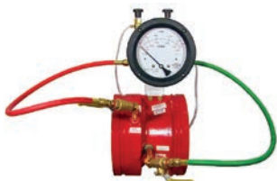
Flow Meter VLF-F-1200