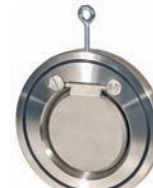
Wafer Check Valve VLF-C-600