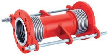
Dilatation Expansion Joint VLF-EJ-400