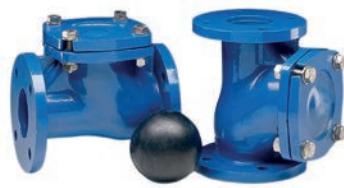
Ball Check Valve VLF-C-500