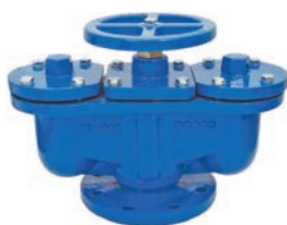
Double Ball Air Valve VLF-AV-100