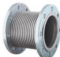
Metal Expansion Joint VLF-EJ-200

ST37 Steel · Сталь - GG25 Cast Iron · Чугун