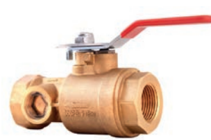
Test Drain Valve VLF-F-800