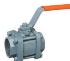
Threaded Ball Valve VLF- KV-400