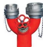
Two Way Inlet VLF-F-1100