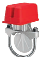
Flow Switch VLF-F-1300