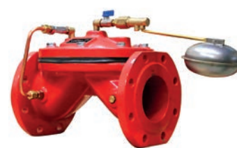
Float Control Valve VLF-D-FLV

Поплавковый регулирующий клапан VLF-D-FLV